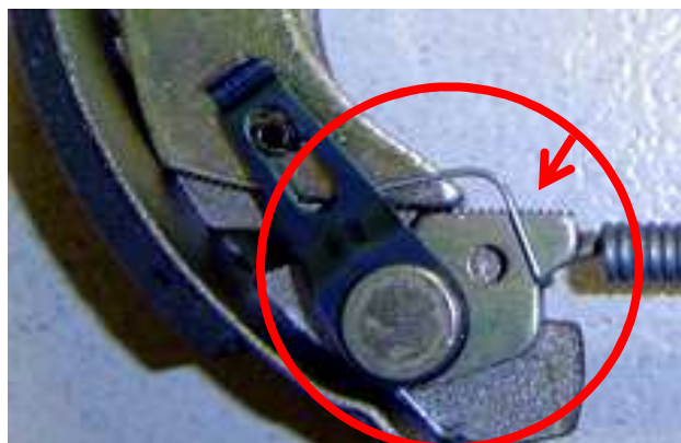
Système de rattrapage automatique incrémentale BENDIX/BOSCH