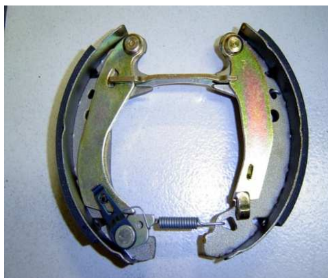
Système de rattrapage automatique à dents BENDIX

Astuce! la forme du cylindre de roue visible au dos de la flasque vous donnent une indication ; Rond = BENDIX Ovale = GIRLING ce n'est pas une certitude à 100%